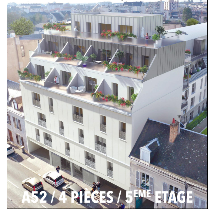
A52 / 4 PIÈCES / 5 ÈME ETAGE

125/127 rue du Fb Bannier, 45000 ORLÉANS