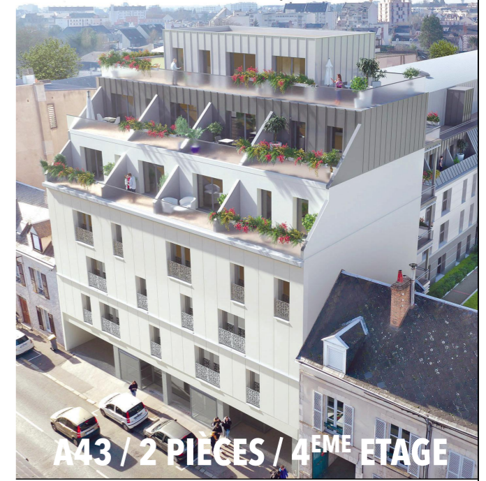
A43 / 2 PIÈCES / 4 EME ETAGE

125/127 rue du Fb Bannier, 45000 ORLÉANS