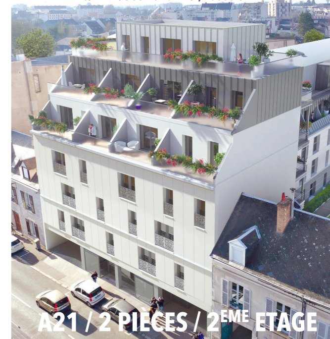
A21 / 2 PIÈCES / 2 EME ETAGE

125/127 rue du Fb Bannier, 45000 ORLÉANS