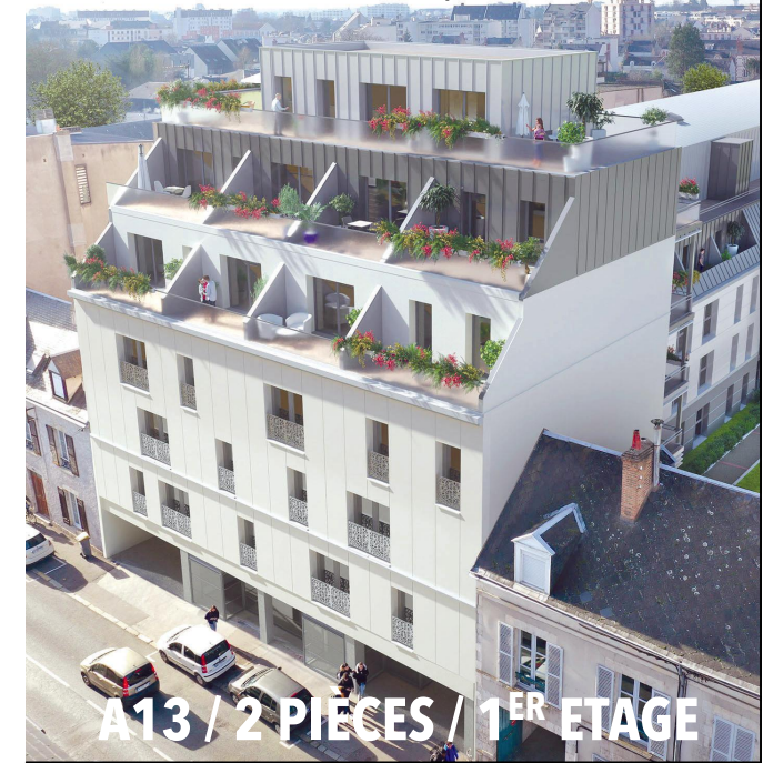
A13 / 2 PIÈCES / 1 ER ETAGE

125/127 rue du Fb Bannier, 45000 ORLÉANS